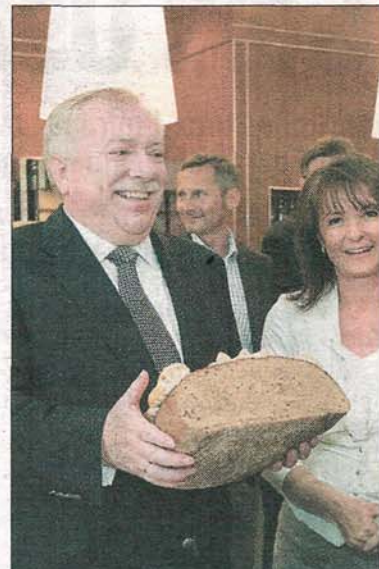
Alle hellauf begeistert: Bürgermeister

Felber ihre neue, ganz besondere Filiale an der Lerchenfelder Straße 38 in Wien-Josefstadt. In der Erlebniswelt können kulinarische Schmankerl von Brot bis Bier in einem eigenen Gastraum konsumiert und genossen werden – und zwar Montag bis Samstag von 6 Uhr früh bis Mitternacht, an Sonn- und Feiertagen von 7 bis 12 Uhr.