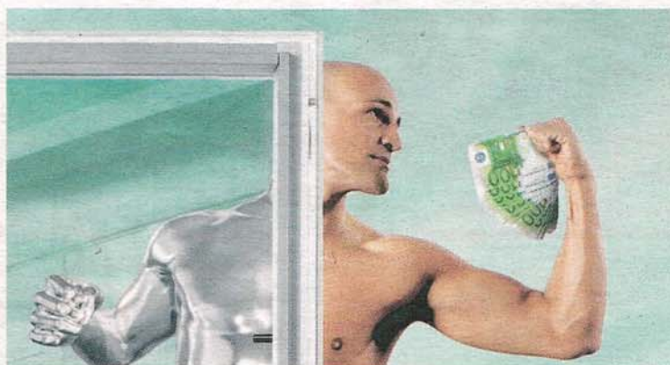
Starkes Produkt: Mit Alufusion neue Förderungen ausnutzen.

Entholzer stark 3 : Die umfassende Beratung ist nur der erste starke Vorteil, der zweite ist ein einzigartiges Produkt: Mit einem U-Wert bis zu 0,62 W/m 2 K (Modell Contur 95) setzen die patentierten Alufusion-Fenster von Entholzer Maßstäbe.