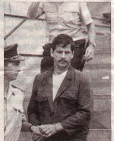
Die Untaten des Belgiers Marc Dutroux schockieren Europa.