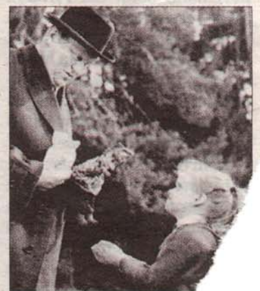
Im Film „Es geschah am 10. Tag“ demonstriert die Schandtat, wie Kinderschänder das Vertrauen ihrer Opfer zerstören.